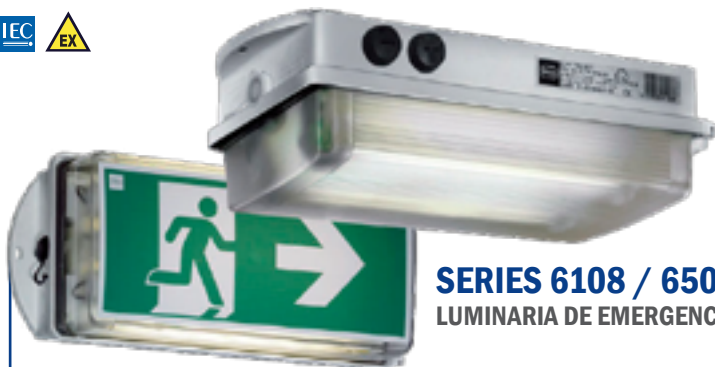
SERIES 6108 / 6508 LUMINARIA DE EMERGENCIA