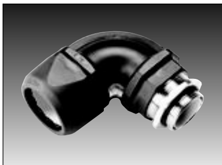
CVW 90° EMV